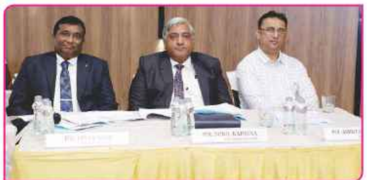
આ પ્રસંગે ઉપસ્થિત બેન્કના પદાધિકારીઓ