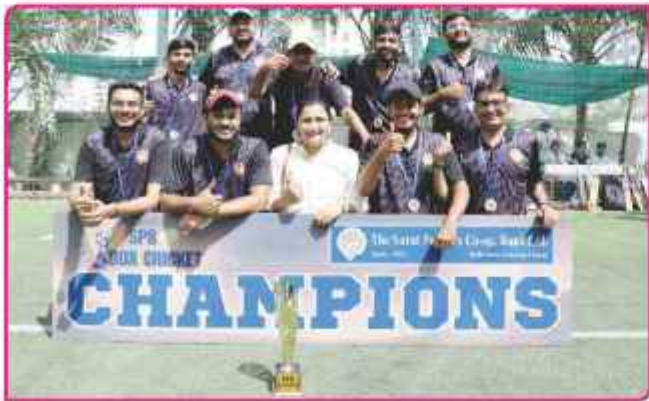
ક્રિકેટ ટુર્નામેન્ટમાં વિજેતા વરાછા શાખાની ટીમ