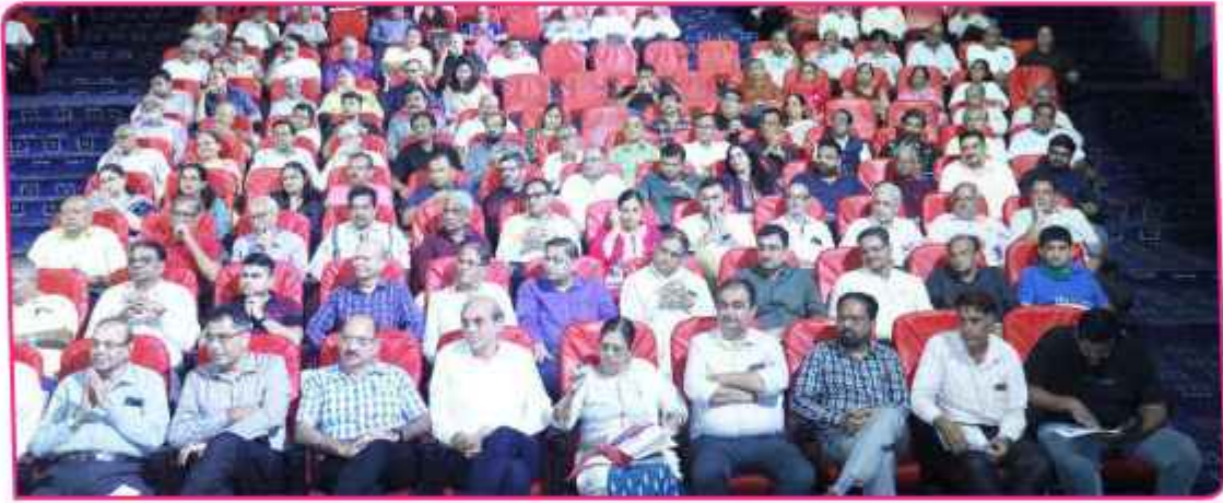
બેન્કની ૧૦૧મી વાર્ષિક સાધારણ સભામાં હાજર રહેલા બેન્કના ડિરેક્ટરશ્રીઓ, બેન્કના પદાધિકારીઓ તથા સભાસદો