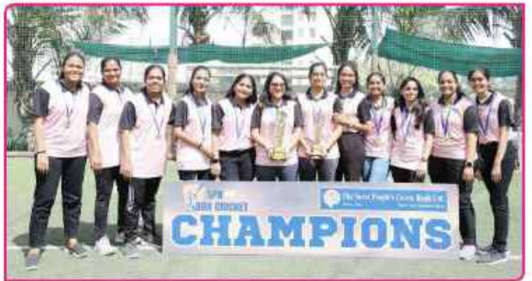
ક્રિકેટ ટુર્નામેન્ટમાં મહિલા વિજેતા ટીમ (ડાબી તરફ) અને રનર અપ ટીમ (જમણી તરફ)