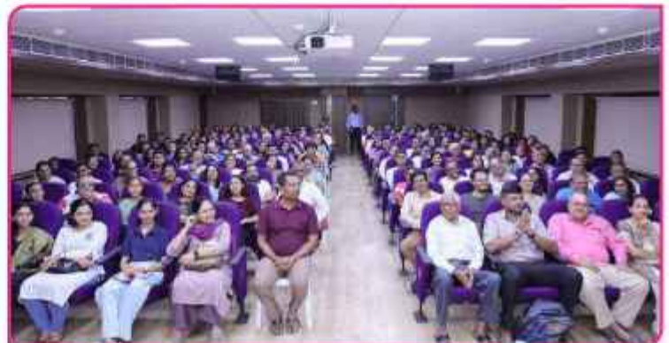
આ પ્રસંગે ઉપસ્થિત વાલીઓ તથા આમંત્રિત મહેમાનો