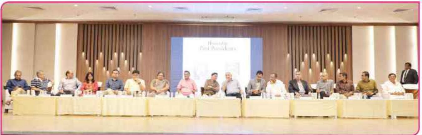
આ પ્રસંગે ઉપસ્થિત બેન્કના પ્રમુખશ્રી, ઉપપ્રમુખશ્રી, ડિરેક્ટર્સ, ભૂતપૂર્વ ડિરેક્ટર્સ તથા બેન્કના પદાધિકારીઓ