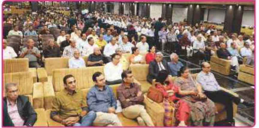
સમારોહમાં ઉપસ્થિત ડિરેક્ટરશ્રીઓ, બેન્કના પદાધિકારીઓ તથા કર્મચારીઓ